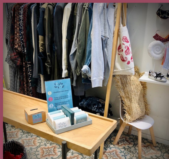
Retrouvez nous chez Zazazou !