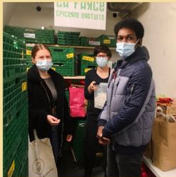
Livraison à la Farce !