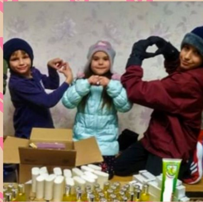
15 kilos de savons envoyés aux orphelins moldaviens !!!