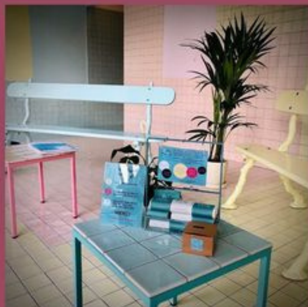
Nos savons chez ORIGIN !