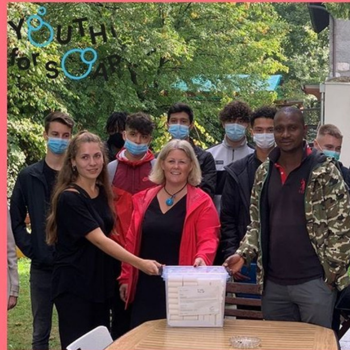
12 kg de savon distribués !